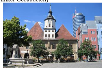
Das 1368 erstmals erwähnte Rathaus am Altmarkt in Jena

Abends: Kulturangebot nach Wahl (noch nicht bekannt)