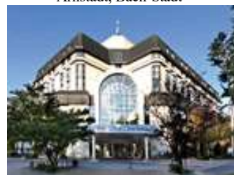
Leonardo Hotel Weimar

Leonardo Hotel Weimar Belvederer Allee 25 99425 Weimar Tel: 03643-722-0