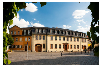
Goethes Wohnhaus mit Nationalmuseum (linker Gebäudeteil)

Abends: 19:30 Uraufführung Johannespassion im Deutschen Nationaltheater oder freie Abendgestaltung